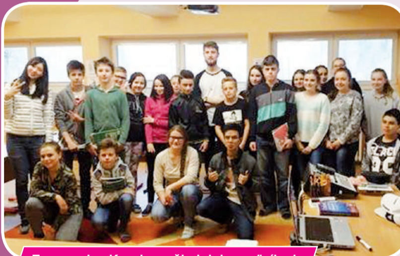
Euoweeek v Korni s našimi dobrovoľníkmi

zapojiť hoci kto zo Slovenska vo veku medzi 18 až 30 rokov hneď bude leto zaujímavejšie. Po tejto výmene budú nasledovať dobrovoľníctva vo všetkých zapojených krajinách.