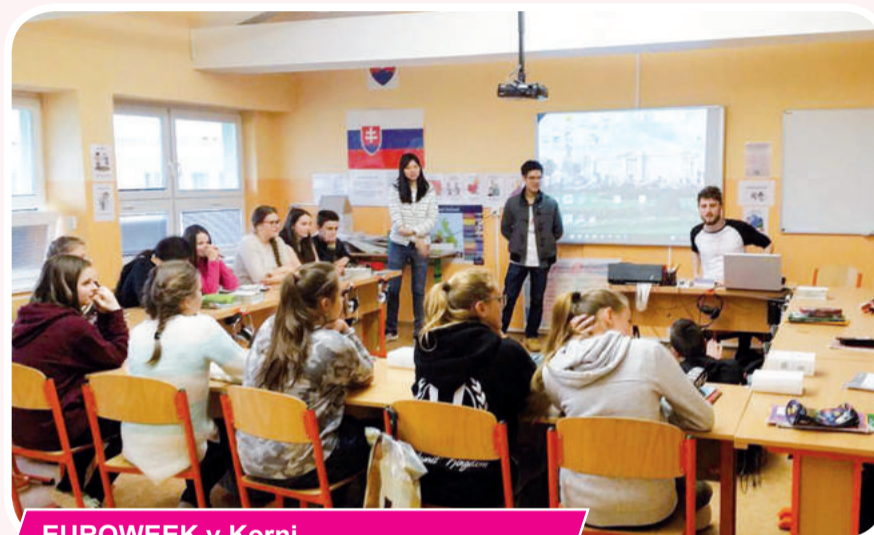
EUOWEEK v Korni

Iný projekt, ktorého je KERiC súčasťou a je dôležitý práve v tejto dobe, keď nás média krmia informáciami o prisťahovalcoch a utečencoch je BROADER. Je to projekt, kde sú zapojené krajiny Taliansko, Rakúsko, Argentína, Mexiko a Slovensko a budú sa zaoberať otázkou imigrácie a utečeneckej krízy v realite. Táto téma, ako to naozaj v realite vyzerá, sa bude najbližšie rozoberať na mládežníckej výmene v Rakúsku od 17. do 24. júla a môže sa