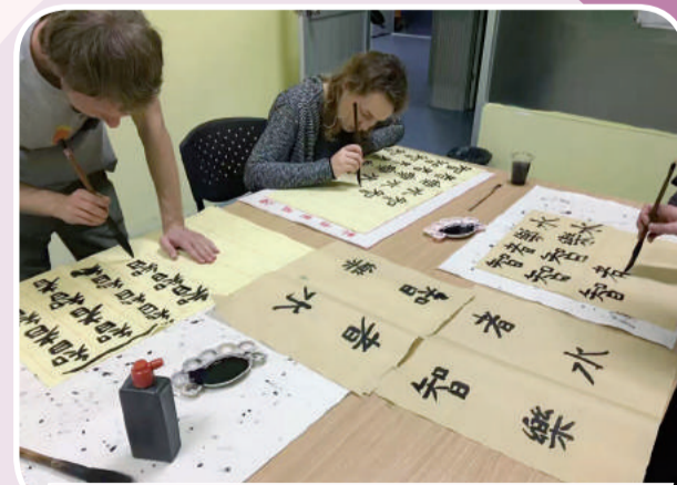
Kaligrafia na projekte v Číne